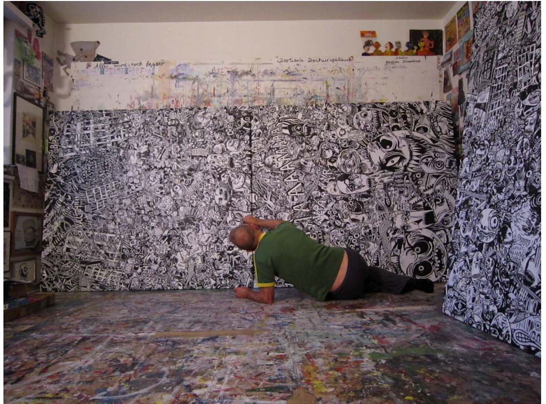
Entstehung GUERNOPOLIS im Atelier, 2015