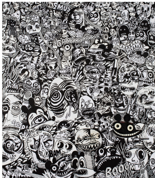
Ausschnitt aus GUERNOPOLIS, 2015