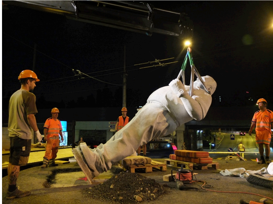
Aufrichten der Kreiselskulptur HEINZ, Sept. 2016.