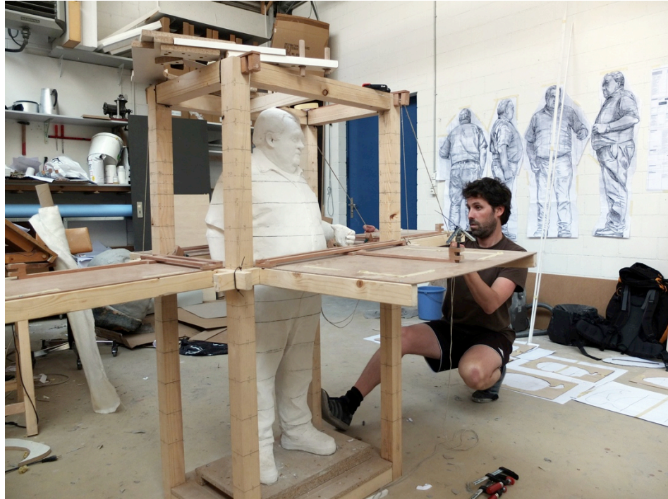
Modellbau im Atelier, 2015.

Für Bilder in Druckqualität (Presseabbildungen) kontaktieren Sie bitte: Shannon Zwicker: shannon.zwicker@kunsthalleluzern.ch