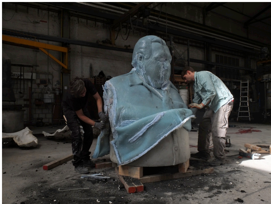
Entformung Betonguss, Kunstgiesserei Münchenstein 2016.