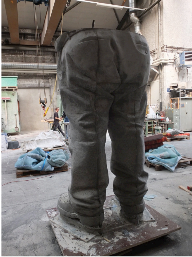
Entformung Betonguss, Kunstgiesserei Münchenstein 2016.