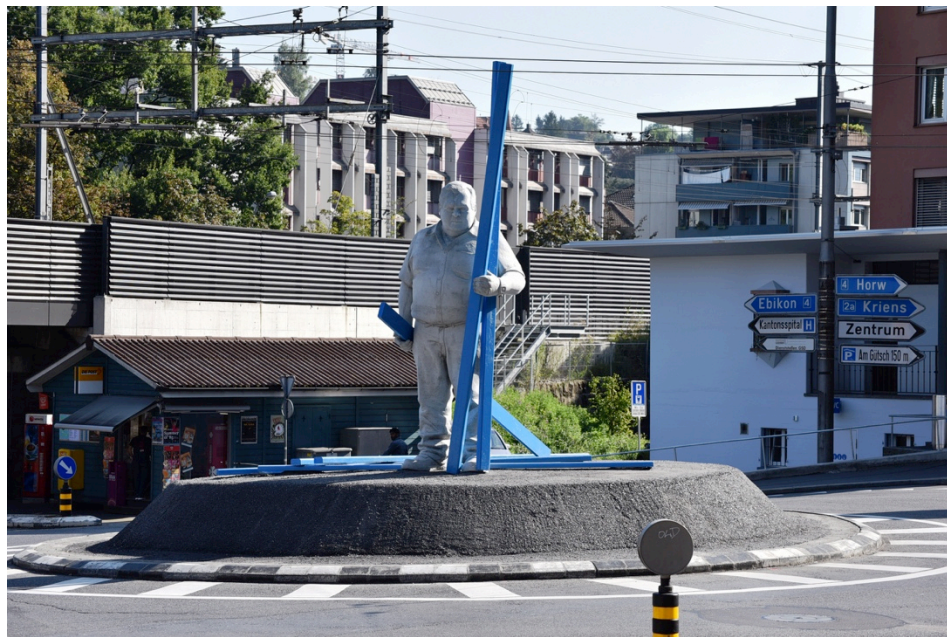
HEINZ, Kreuzstutz-Kreisel, Luzern. Künstler: Christoph Fischer, 2016. Fotografie: Steff Loetscher

Für Bilder in Druckqualität (Presseabbildungen) kontaktieren Sie bitte: Shannon Zwicker: shannon.zwicker@kunsthalleluzern.ch