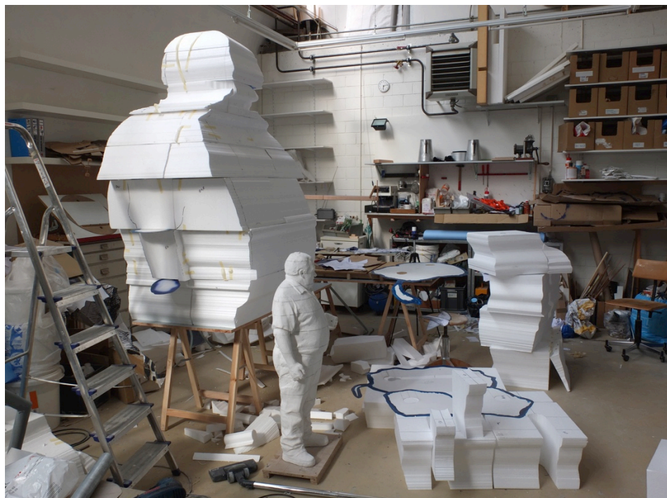
Materialvolumen des Herstellungsprozesses von HEINZ, 2015.