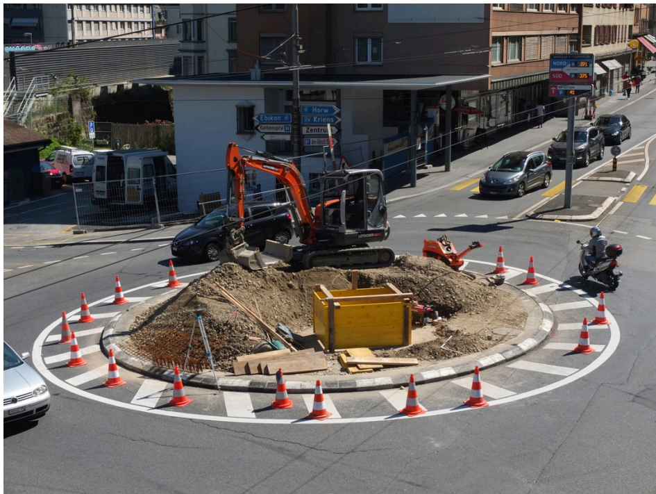
Umbau Kreis Kreuzstutz, Luzern, 2016.