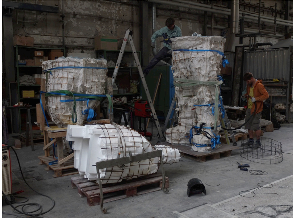
Schalung für Betonguss, Kunstgiesserei Münchenstein 2016.