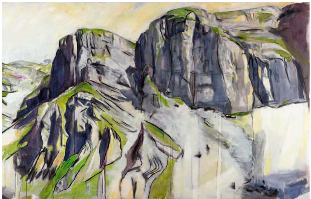
Barbara Gwerder – AlpStreich Nr. 33, Mischtechnik auf MDF, 115cm x 170cm, 2015 bis 2018.