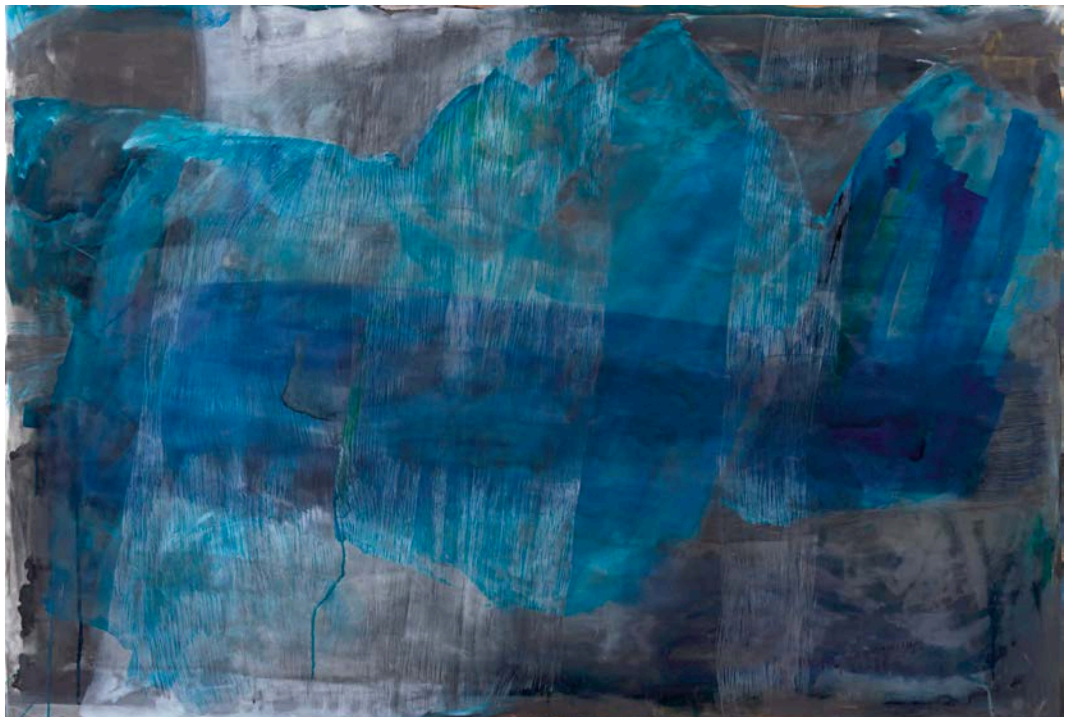
Barbara Gwerder – AlpStreich Nr. 13, Mischtechnik auf MDF, 115cm x 170cm, 2015 bis 2018.