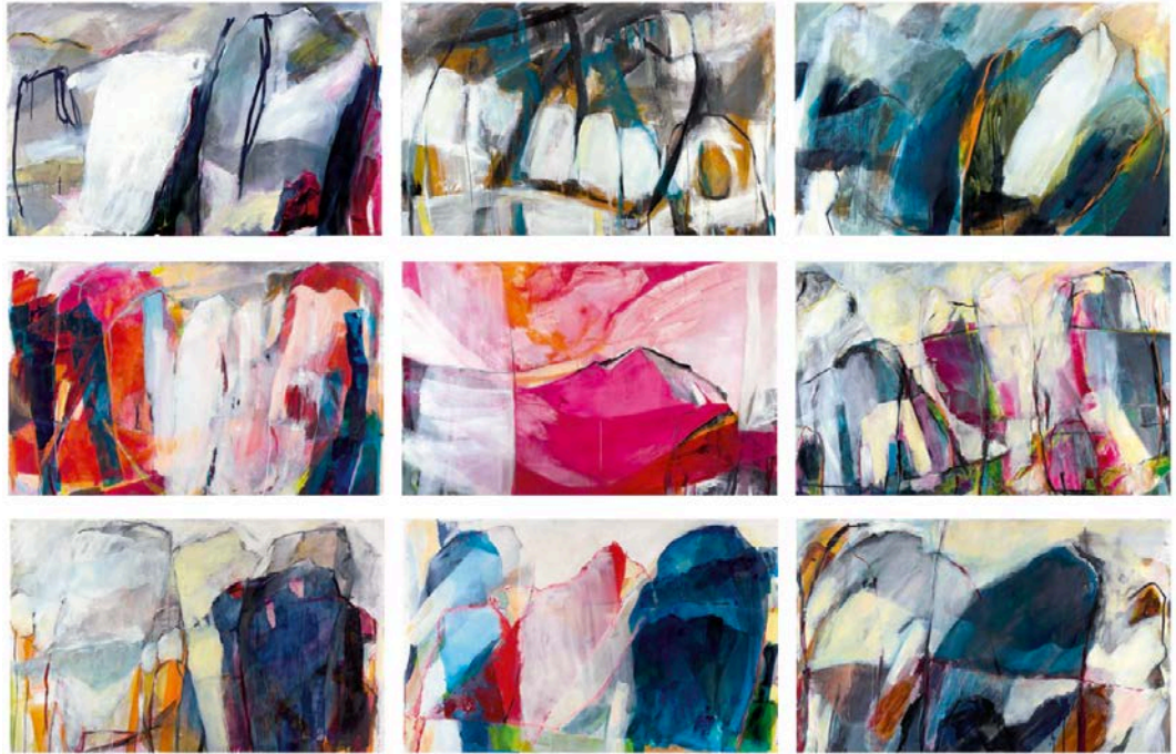
Barbara Gwerder – Werke aus der Serie AlpStreich , Mischtechnik auf MDF, 115cm x 170cm, 2015 bis 2018.

Für Bilder in Druckqualität (Presseabbildungen) kontaktieren Sie bitte: Shannon Zwicker: shannon.zwicker@kunsthalleluzern.ch