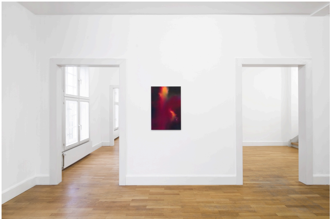
Giacomo Santiago Rogado – Ausstellungsansicht «Anfang von etwas», Städtische Galerie Delmenhorst, Deutschland, 2021.