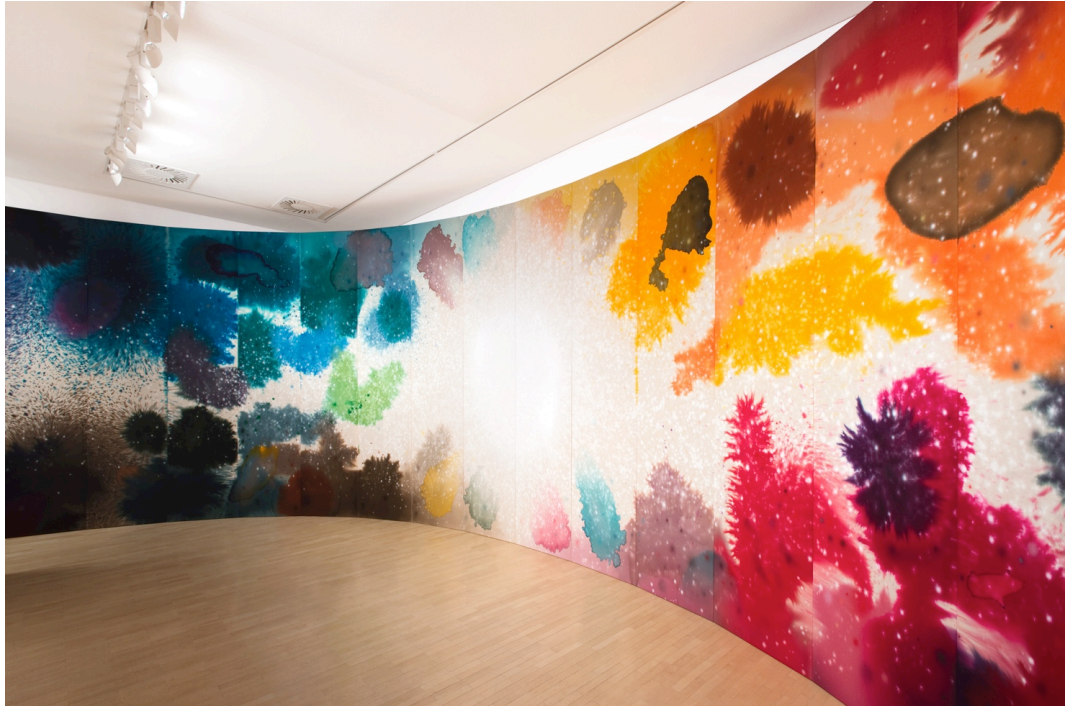
Giacomo Santiago Rogado – Ausstellungsansicht «Anfang von etwas», Städtische Galerie Delmenhorst, Deutschland, 2021.