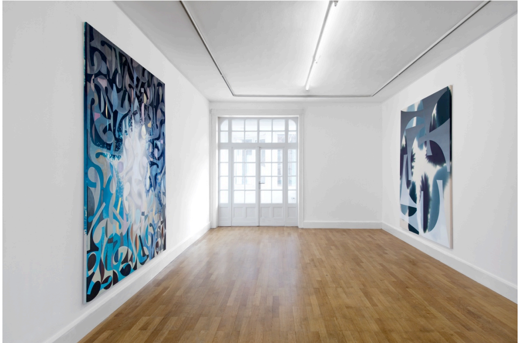
Giacomo Santiago Rogado – Ausstellungsansicht «Anfang von etwas», Städtische Galerie Delmenhorst, Deutschland, 2021.