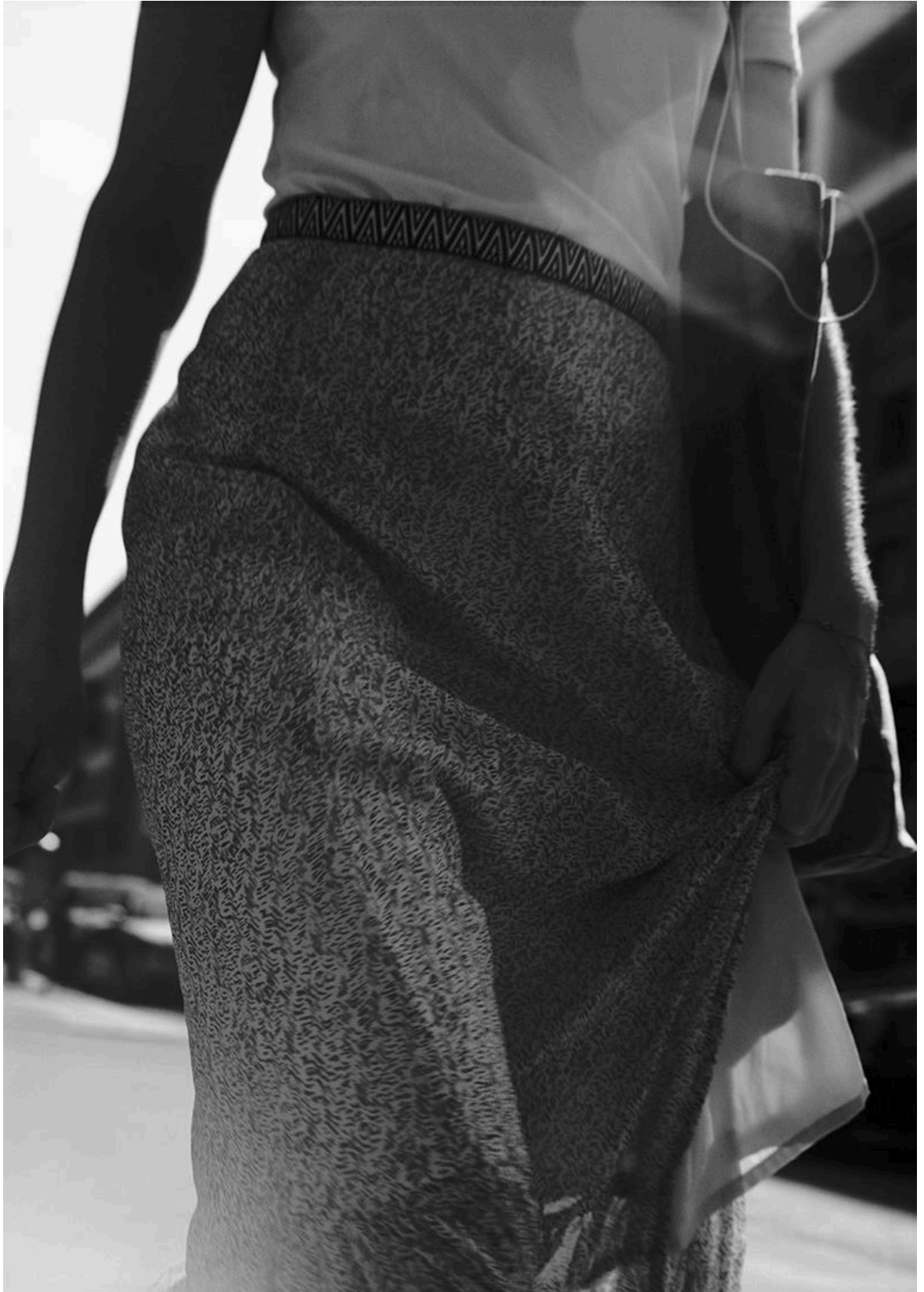
Lukas Hoffmann – Strassenbild XIX , 2018, Silbergelatineabzug, 102cm x 72cm. Fotografie: Lukas Hoffmann