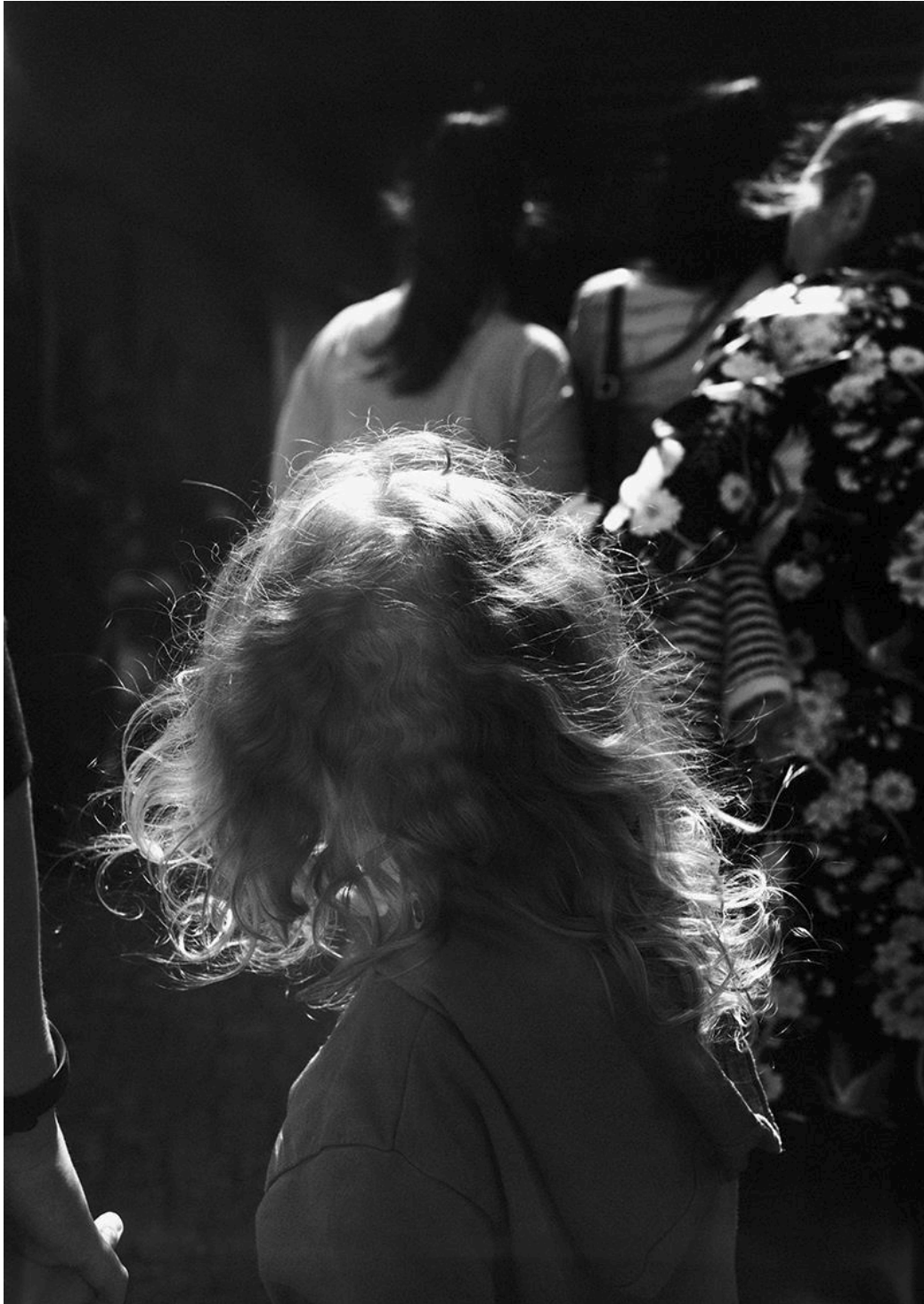
Lukas Hoffmann – Strassenbild I , 2018, Silbergelatineabzug, 102cm x 72cm. Fotografie: Lukas Hoffmann

Jeanine Burkard: jeanine.burkard@kunsthalleluzern.ch