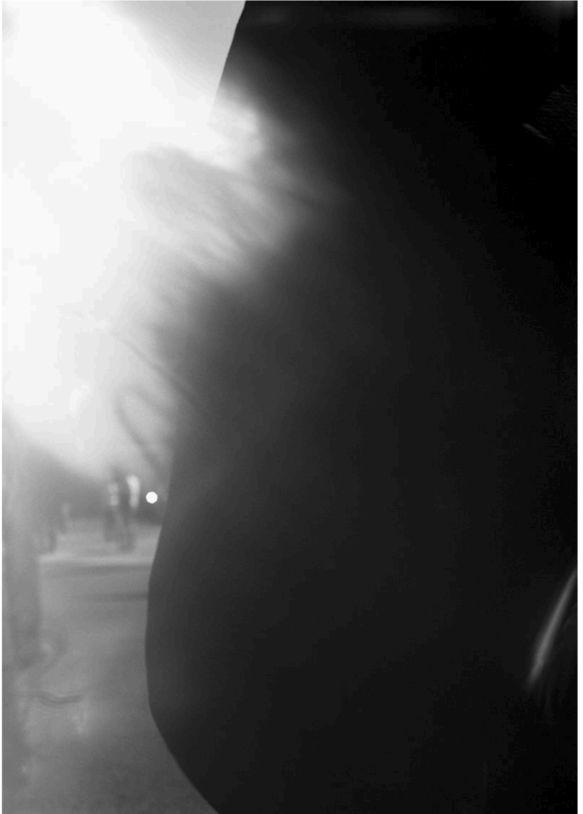
Lukas Hoffmann – Strassenbild XX , 2018, Silbergelatineabzug, 102cm x 72cm. Fotografie: Lukas Hoffmann