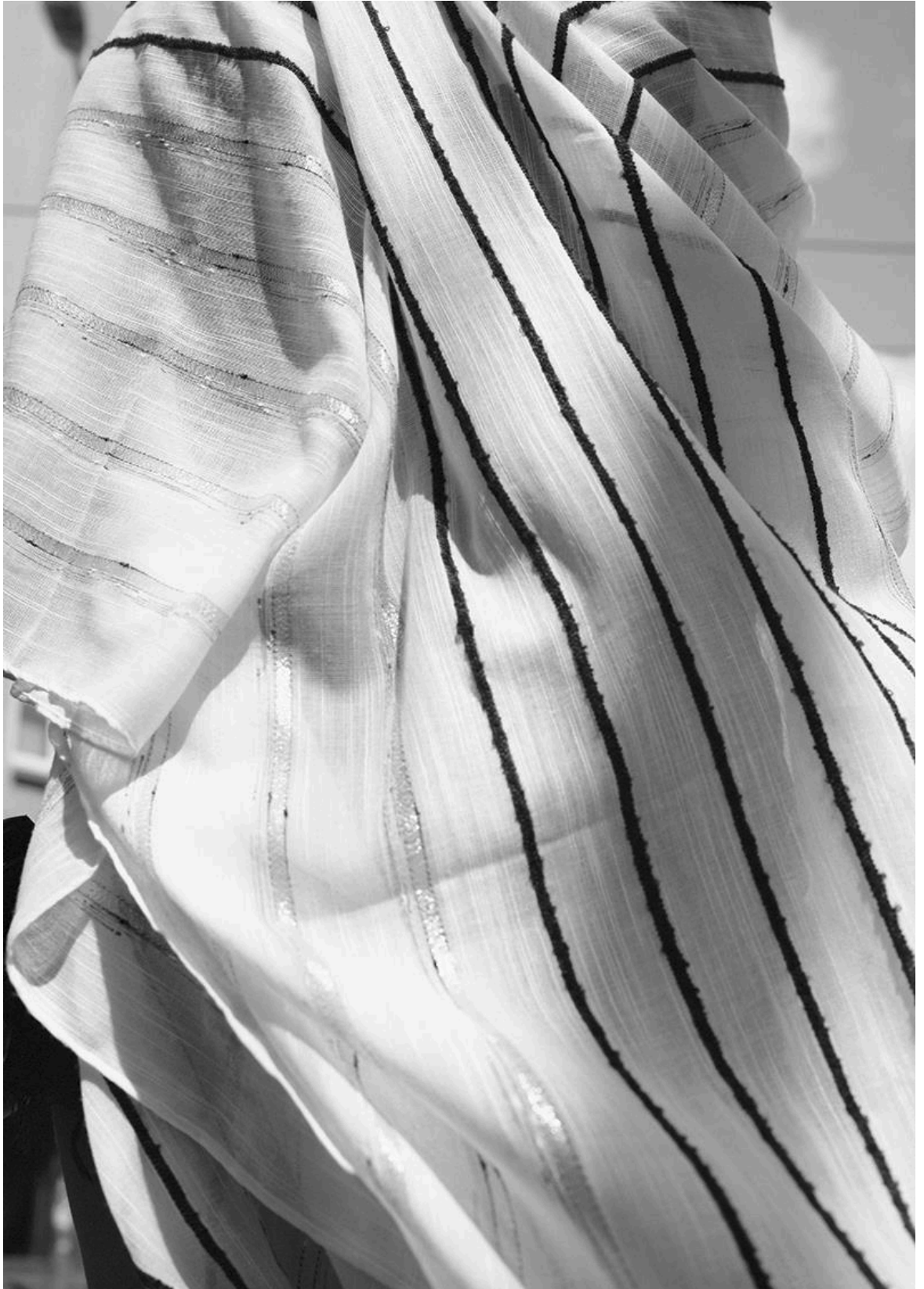
Lukas Hoffmann – Strassenbild XI , 2018, Silbergelatineabzug, 102cm x 72cm.