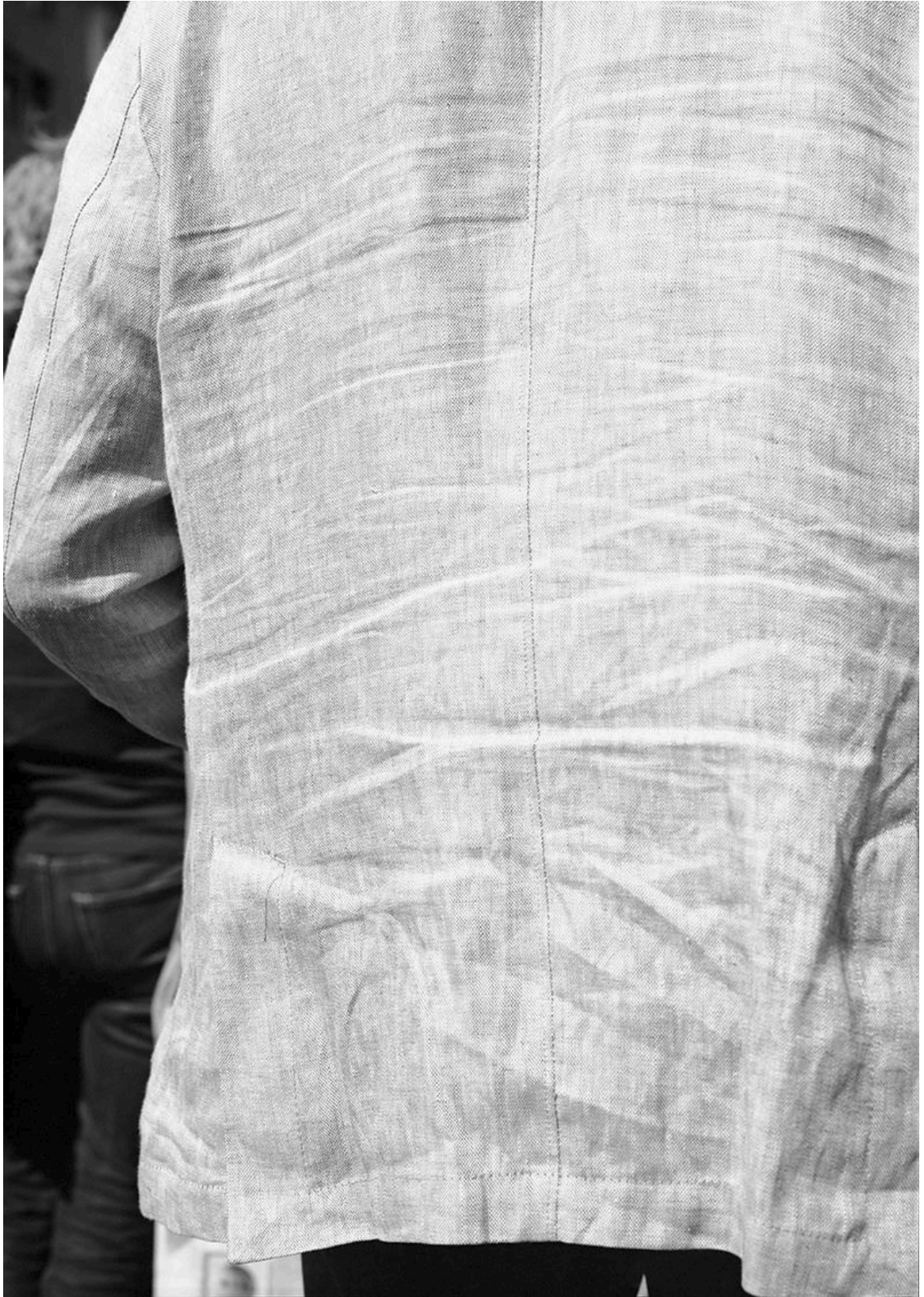
Lukas Hoffmann – Strassenbild XXI , 2018, Silbergelatineabzug, 102cm x 72cm. Fotografie: Lukas Hoffmann