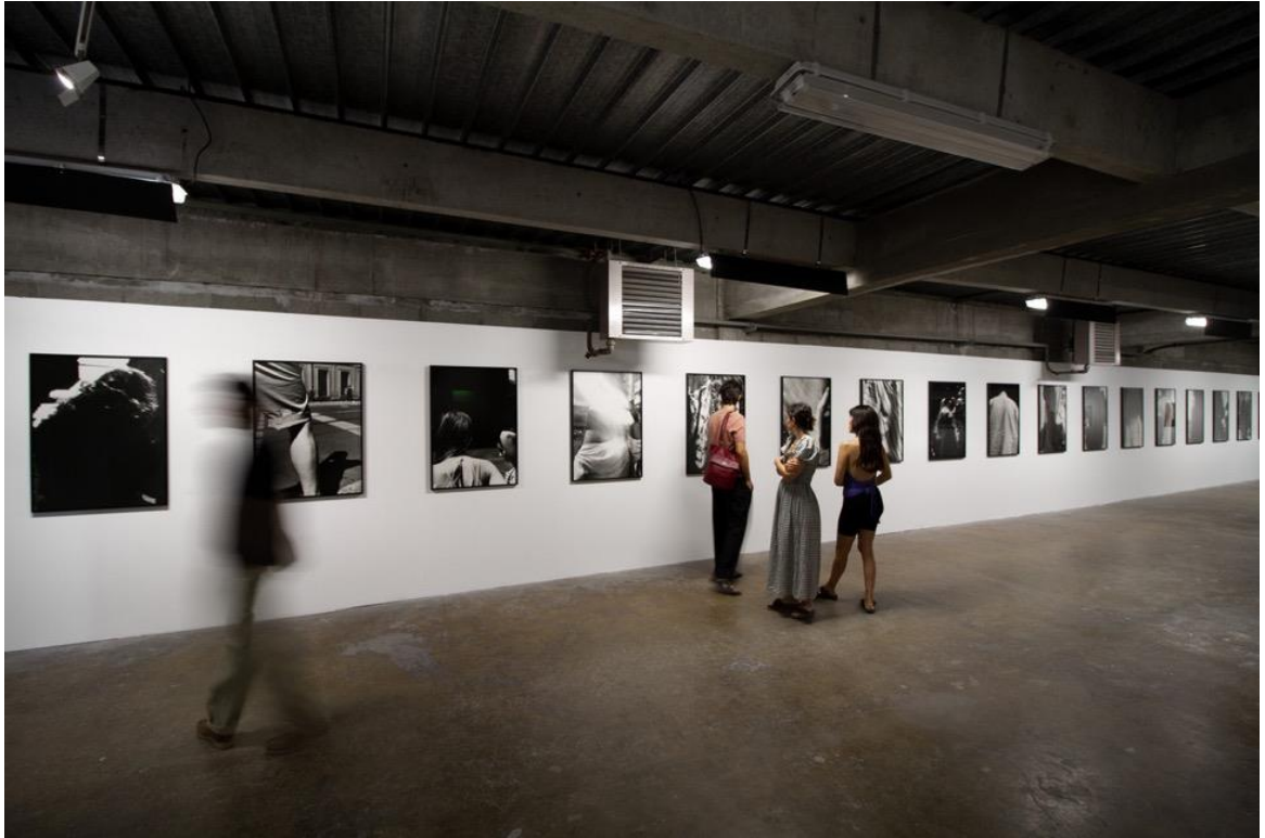
Lukas Hoffmann – Ausstellungsansicht, Strassenbilder , Rencontres de la Photographie, Arles, 2022.