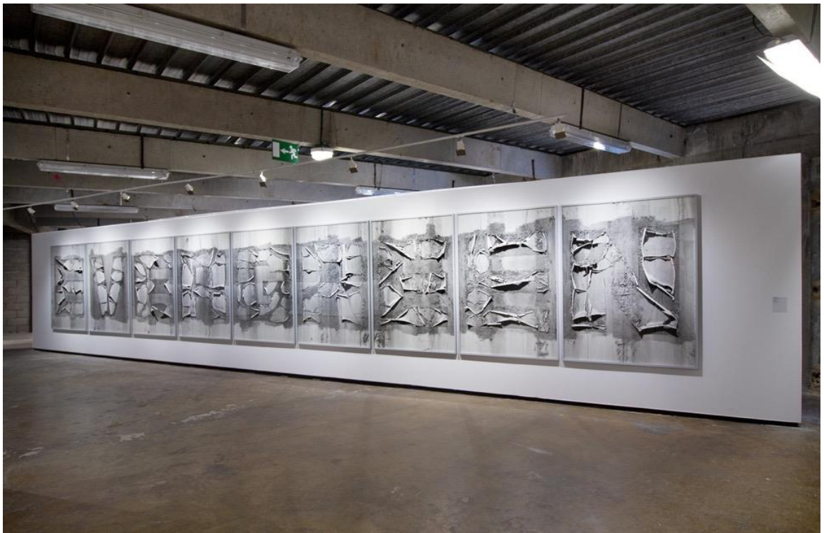
Lukas Hoffmann – Ausstellungsansicht, Evergreen , Rencontres de la Photographie, Arles, 2022.