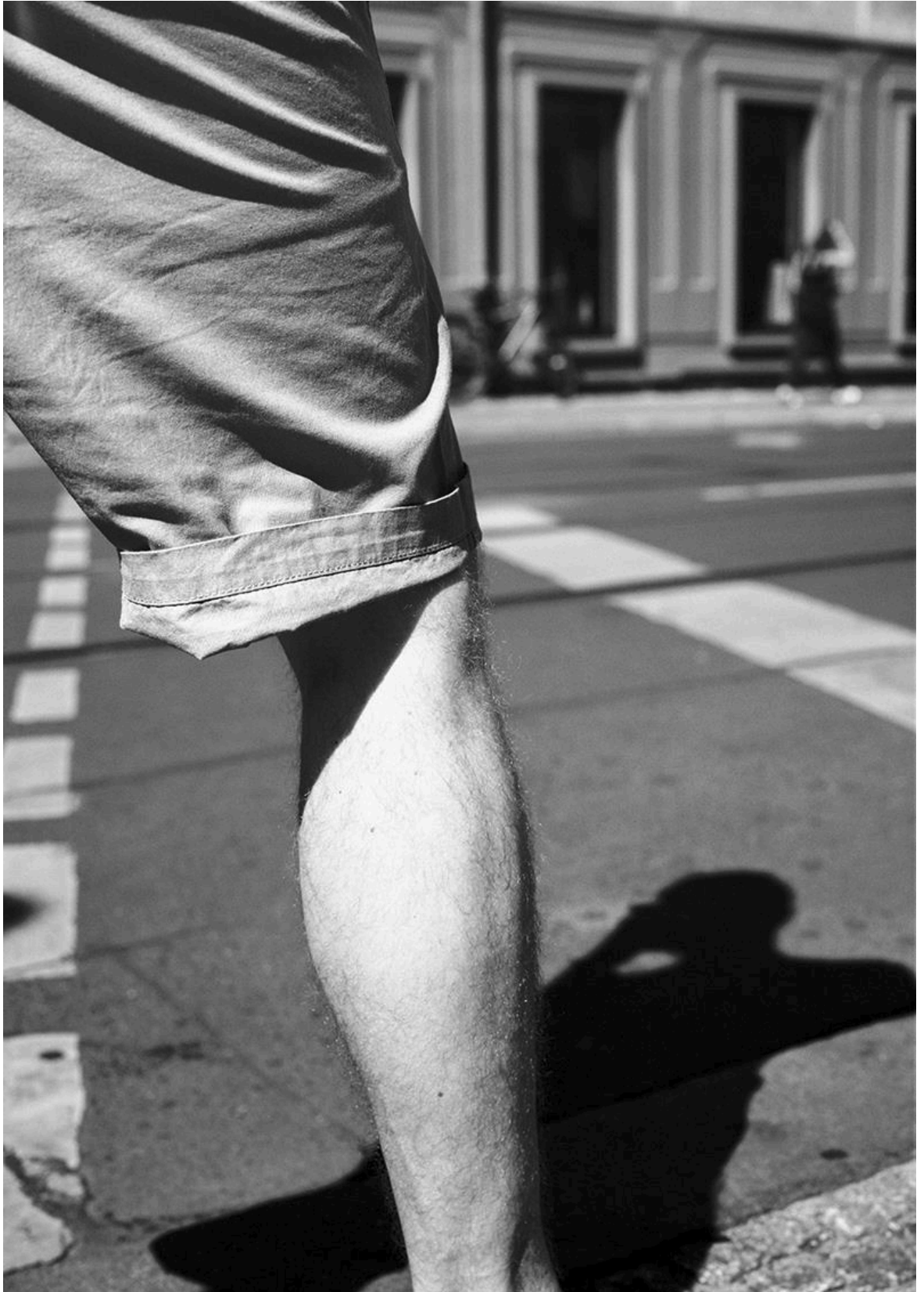
Lukas Hoffmann – Strassenbild XII , 2018, Silbergelatineabzug, 102cm x 72cm.