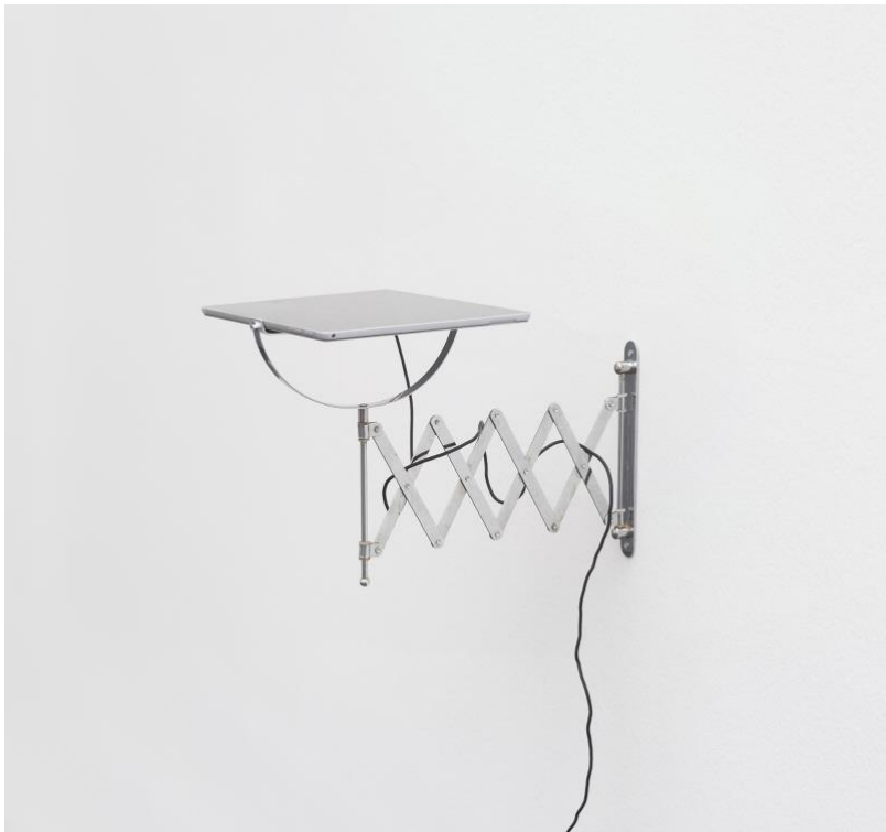
Oben: René Gisler, Detail aus der Installation «Malen nach Zahlen», Ausstellungsansicht Galerie Niedervolta, Altdorf, 2011.